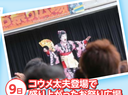
9日 コウメ太夫登場で盛り上がったお祭り広場