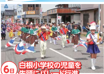
6日 白根小学校の児童を先頭にパレード行進