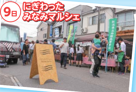
9日 にぎわったみなみマルシェ