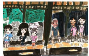
昨年の絵画展の作品

期間 11月1日(金)~20日(水) 午前9時~午後10時※11月15日(金)は休館 場所 白根学習館1階ロビー(交流広場)