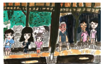
昨年の絵画展の作品

期間 11月1日(金)~20日(水) 午前9時~午後10時※11月15日(金)は休館 場所 白根学習館1階ロビー(交流広場)