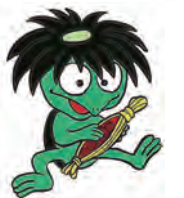
イラスト:高橋郁丸