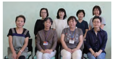
スタッフの皆さん