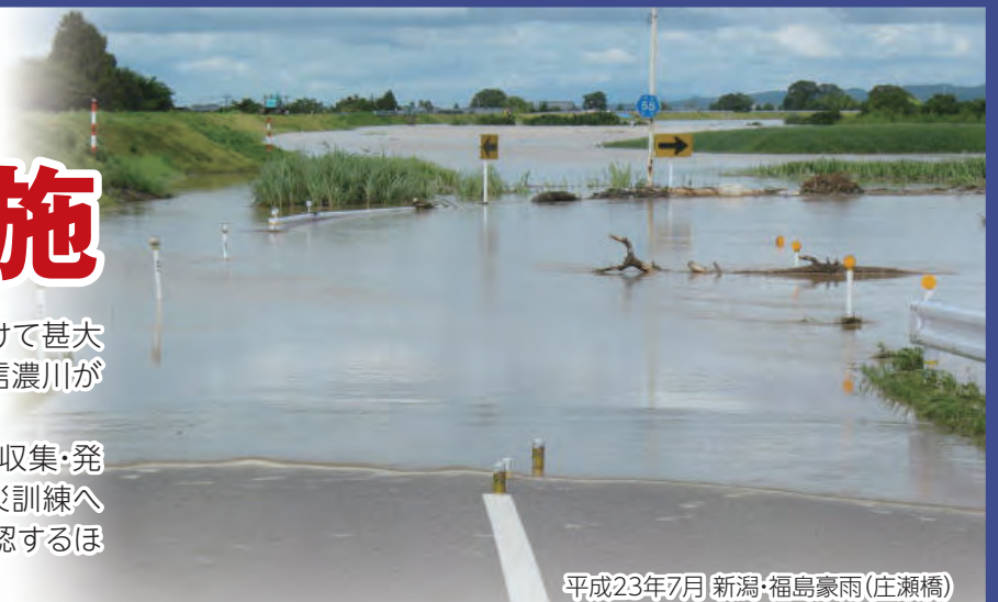
平成23年7月 新潟・福島豪雨(庄瀬橋)

より一層の防災意識の向上や今回の教訓を踏まえ、水害を想定した「情報の収集・発信」と「避難所の開設」を中心に南区総合防災訓練を行います。地域の自主防災訓練への参加や全戸配布している「新潟市総合ハザードマップ」で避難場所などを確認するほか、いつ起きるか分からない災害に備えましょう。