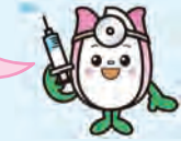
新潟市食育花育推進キャラクター まいかちゃん