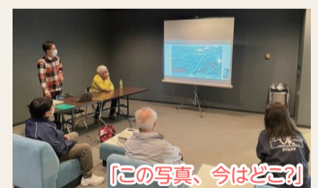
「この写真、今はどこ?」

○しろね大風と歴史の館を会場に事業を行いました。 ○「白根大風合戦と商店街の今昔」では白根商店街の昔の写真のパネルや、白根大風合戦の歴代ポスターを展示しました。 ○「この写真、今はどこ?」はクイズ形式で、昔の写真を映写し、参加者が現在の場所を考えました。 ○映画「白根紙鷲見聞録風ノ国」の上映会には、大勢の人が観覧に訪れました。