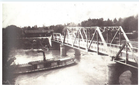
味方橋と安進丸 水かさが増すと煙突が船員2~3人で倒して橋の下を通った