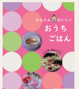
地産地消レシピ集

①地産地消レシピを活用して白根高校生が調理体験を実施します。 ②“心と身体の健全な発育”を体現する川合俊一氏(日本バレーボール協会会長)をお招きして、トークセッションを開催します。