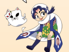
しろね大風と歴史の館 キャラクター 大空トイカ&ねこ太