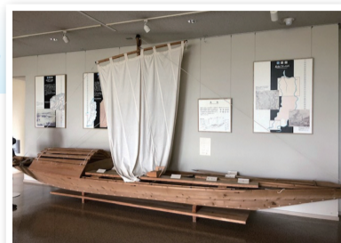
明治・大正期に活躍した長船 (しろね大風と歴史の館)

中ノ口川にはその昔、船が往来する風景がありました。川を渡るとき、ちょっとその風景を想像してほしいな～！