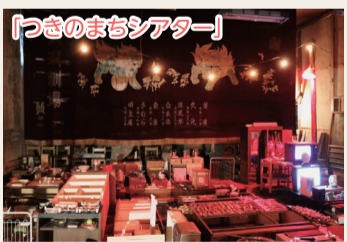
「つきのまちシアター」

○月潟農村環境改善センターに展示している角兵衛獅子などの資料や、かつての映画館「月潟劇場」を調査し、ホームページに結果を公開しました。 ○月潟地区全体を舞台に、イベント「つきのまちシアター」を開催。「月潟劇場」にあった日用品、資料、映像を交えてアート展示をし「月潟稽古場」では映画を上映するなど、魅力的な空間を生み出しました。