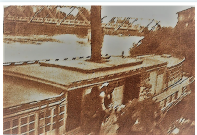
「安進丸」 味方の船着き場での荷物の上げ下ろし