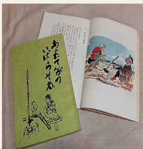
冊子「あつたてんがのいばらそね」

地域の昔語りを集めた冊子「あつたてんがのいばらそね」から舞台劇用の台本を作成し、専門家指導の下で地域の子どもが大人と共に練習し、地域のイベントなどで発表します。