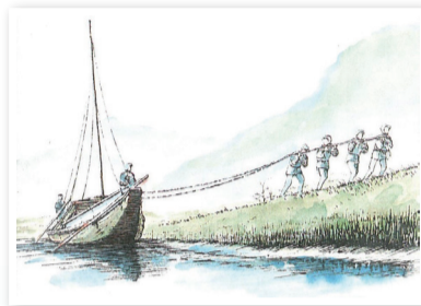
動きの悪くなった船を岸から引っ張った

1889(明治22)年、新潟-燕間を安進社の「安進丸」が就航。1897(明治30)年には白根船会社の「白根丸」も新潟-白根間に就航し、全盛期を迎えました。しかし、大正期に入ると大河津分水の完成による水位の低下や陸上交通の発展に伴い、路線を縮小していきました。1935(昭和10)年に白根曳船会社、1938(昭和13)年には安進社が解散しました。