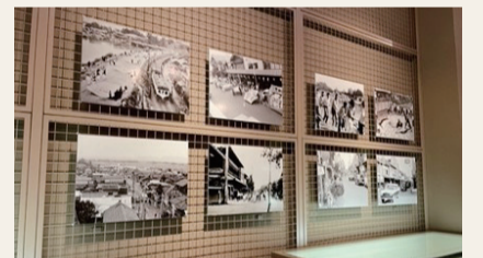
昨年度の写真展示の様子

白根大風合戦と商店街の今と昔の写真の展示、ドキュメンタリー映画「風ノ国」の上映、白根の古い写真を用いたクイズ企画を実施します。