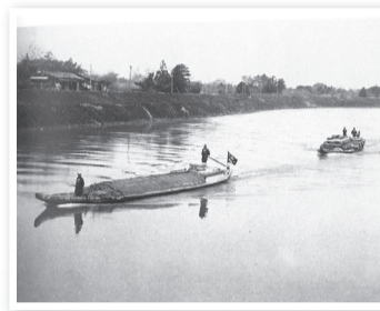
中ノ口川を上る川船 前の船は肥料、後は木材を積んでいる (白根神社付近から撮影)