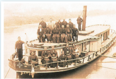
「白根丸」 新潟-白根間を運航していた