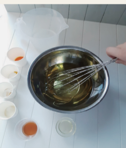
ルレクチエのせっけん作成の様子

果樹のハネもの(形や大きさなどが規格外のもの)を活用し、ルレクチエなどのせっけんの開発・販売を農家・学生・事業者が連携して行います。食品以外に加工することにより、ハネもの活用の幅を広げます。