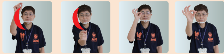
①頭の上から顎の前に向けて ②人差し指と親指を付けた輪を人差し指と親指で月を描きます のぞきながら前に出します