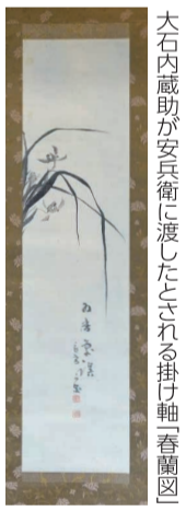
大石内蔵助が安兵衛に渡したとされる掛け軸「春蘭図」

記念講演会 先着200人 入場無料 回 11月13日(日)午後1時半～3時半 回 同館 ラスペックホール 回 平日午前9時～午後5時に庄瀬地域生活センター ☎372-2901