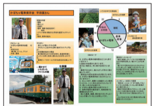
「地域を支える仕事人の図鑑 Vol.2」

ドル」の製作をしています。アイスキャンデルの製作には、地域の皆さんにも協力してもらい、温かい炎で幻想的な世界を演出します。