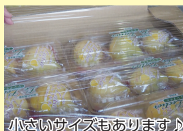
小さいサイズもあります♪