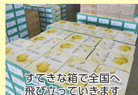
すてきな箱で全国へ飛び立っていきます