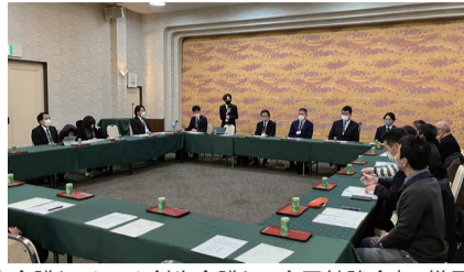
「南区創生会議とにしかん創生会議との合同勉強会」の様子

創生会議は、南区で活躍する民間団体から選ばれた若手の皆さんが柔軟な発想と行動力で南区のために活動しています。どんな活動をしているのかな?