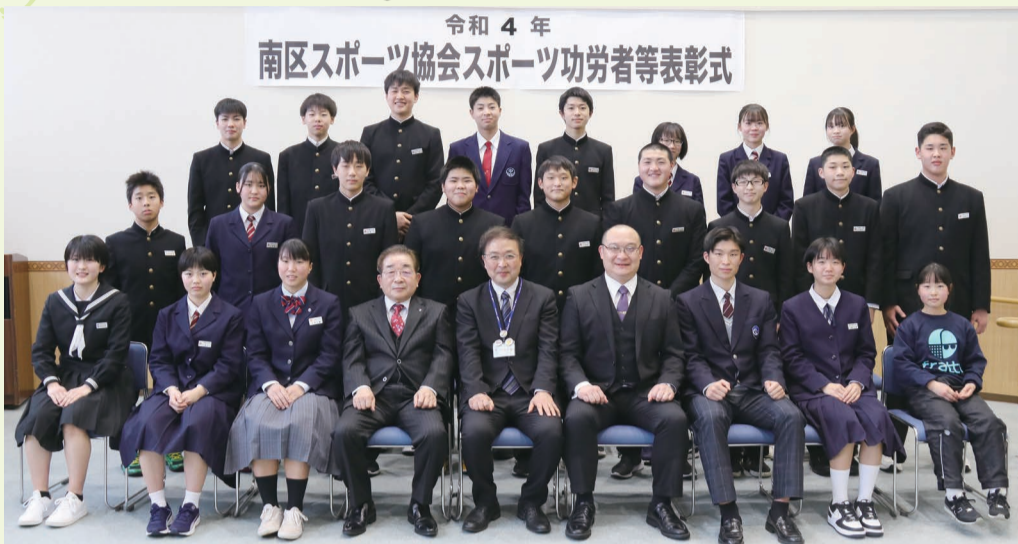
令和4年 南区スポーツ協会スポーツ有功者等表彰式

2月19日、令和4年にスポーツで優秀な成績を取めるなど、区のスポーツ振興に貢献した37人を南区スポーツ協会が表彰しました。