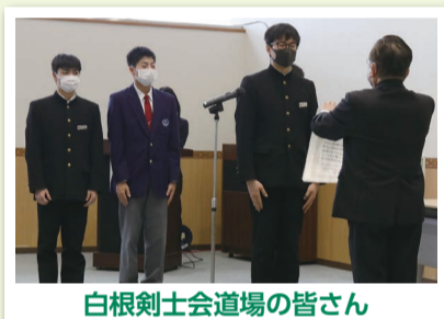
白根剣士会道場の皆さん

今後の目標は、高校進学後も競技を続け、インターハイなどの大きな大会に出場することです。