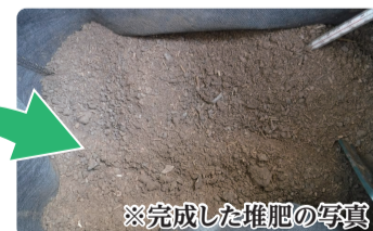
※完成した堆肥の写真