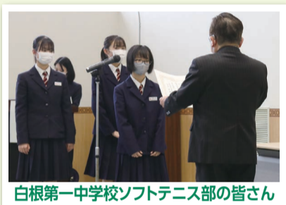
白根第一中学校ソフトテニス部の皆さん