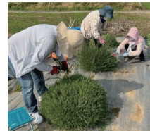
空いている時間を使って作業します

ラベンダーは花を目で楽しむだけでなく、クラフトも楽しめます。ヒーリングなどさまざまな効果がある香りに包まれながらの作業は、作業する私たちにも幸福感を与えてくれます。私自身が女性であることから「女性が楽しめる内容、参加しやすい方法」を意識して、活動を工夫しています。幅広い年代の女性が集まるメンバーは、作業を通じて仲良くなり、積極的に「次はこうしたい」とアイデアを出してくれます。農業が盛んな南区だからこそ、地域の資源を生かした楽しみ方をこれからも見つけたいです。