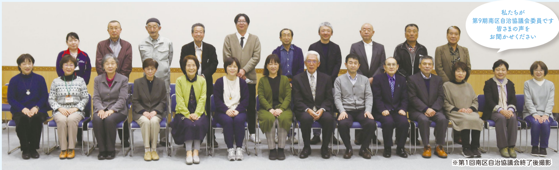
※第1回南区自治協議会終了後撮影