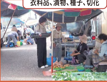
販売しているもの 野菜、果物、乾物、魚類、 衣料品、漬物、種子、切花