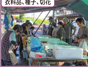
販売しているもの 野菜、果物、魚類 衣料品、種子、切花