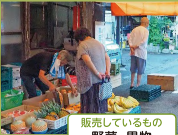
販売しているもの 野菜、果物