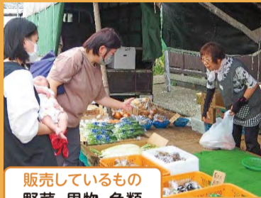
販売しているもの 野菜、果物、魚類 衣料品、種子、切花