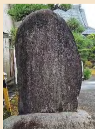
庄瀬市の起りを示す「開市碑」

白根市の歴史が一番古く、元禄時代(約300年前)に始まりました。同じ頃に新飯田市、その後に月潟市(宝暦時代)、庄瀬市(明治時代)の順で開設されました。