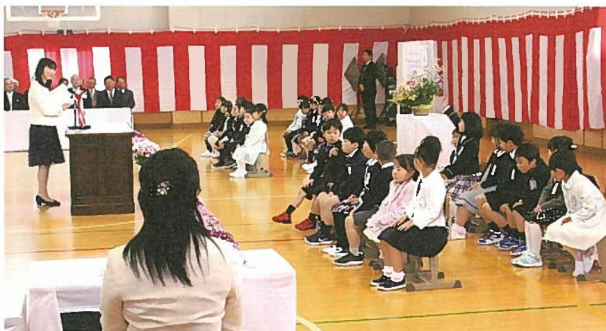
▲名前を呼ばれ元気に返事をする一年生

一年生は、これからの学校生活で、いろいろな新しい経験を積み重ねていきます。楽しいこと、大変なこと、いろいろなあると思います。が、友達と励まし合いながら大きく成長してほしいと思います。 一年生のみなさん、ご入学おめでとうございます。