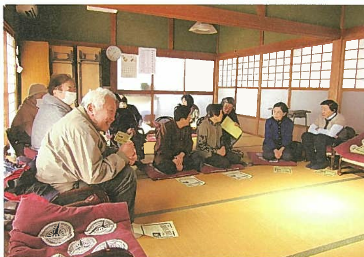
▲いきいきと活動される「大別當お茶の間」

地域をはじめ、多くの皆様のご協力での賞をいただきました。これからも魅力ある「お茶の間」活動を通して、健康寿命延伸に努力してまいります。