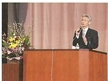
▲ わかり易く丁寧に講演いただきました