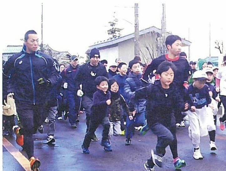
▲今年も元気にスタートを切りました

一年のスタートを切るのに、この大会はうってつけです。来年も大勢の皆さんの参加をお待ちしています。