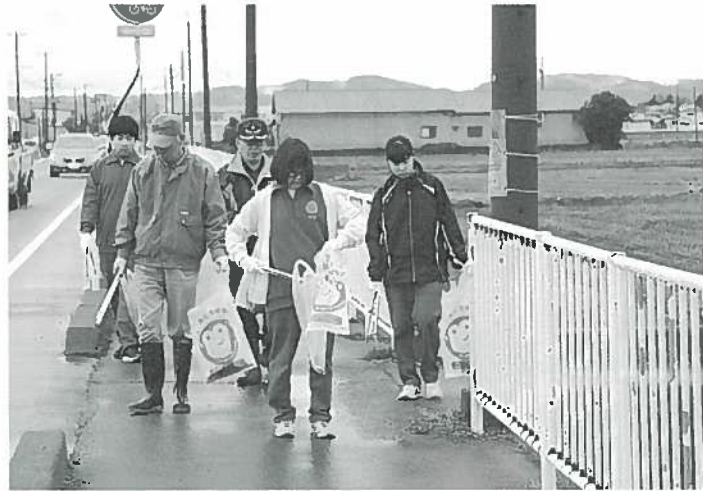
▲ ボランティアの皆さん、お疲れさまでした。

去る4月7日(土)早朝、春の農作業を前に、月潟コミュニティ協議会主催による環境美化活動(ごみ・空き缶拾い)を実施しました。雨が上がり、中学生を含む約100人のボランティアと各地区の老人クラブ会員約100人からも参加をいただき、地域内の6幹線道路や主要農道を清掃しました。約1時間の作業でしたが、今回は専用のごみ袋を「燃やすごみ」「燃やさないごみ」の2つにしたことで、回収後の細かい分別がなくなりスムーズでした。ボランティアの皆さん、ありがとうございました。