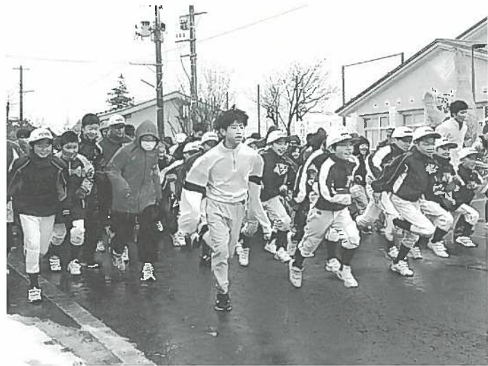
▲ みぞれの降る中、元気にスタート！

皆さんも元旦マラソンで一年のスタートを切りませんか。来年は第40回の記念大会です。大勢の皆さんの参加をお待ちしています。