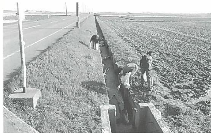
▲ ボランティアの皆さん、ありがとうございました。

月潟コミュニティ協議会主催による恒例の『ごみ・空き缶拾い』を4月6日(土)早朝実施し、約80人のボランティアで地区内の主要道路沿いの清掃作業をしました。