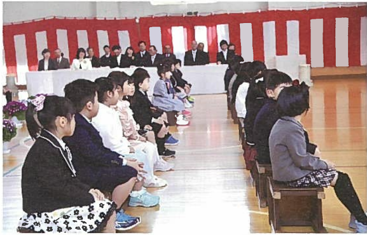
▲お行儀よくお話を聞く1年生

これからの学校生活では、たくさんさんの「はじめの一步」を踏み出し、成長していく1年生です。楽しいこと、大変なこと、いろいろあると思いますが、友達と励まし合いながら、大きく成長してほしいと思います。一年生のみなさん、ご入学おめでとうございます。