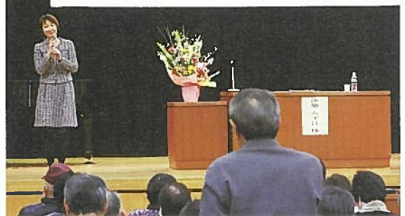
▲ 「月潟の名物、名産は？」に答える来場者。