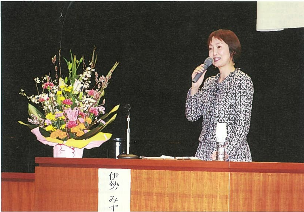
▲ ふるさとの魅力の発信について語っていただきました