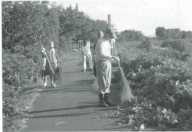
▲ ボランティアの皆さんおつかれさまでした

大道芸フェスティバル前の9月14日(土)、中ノ口川堤防遊歩道の除草を行いました。 午前6時30分、地域住民等約40人のボランティアが旧月潟駅駐車場に集合、鎌やほうき、熊手で遊歩道脇や桜等の樹木周りの雑草を処理しました。 約1時間で作業を終了。ボランティアの皆さん、ありがとうございました。