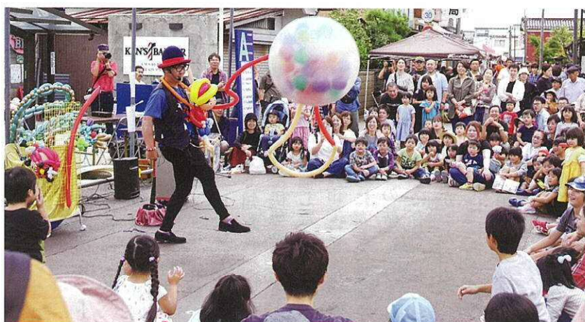
▲ 心配された台風の影響もなく、多くの人で賑わいました