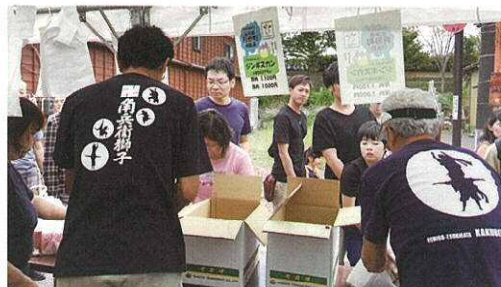
▲ 月形町物産販売 大盛況でした