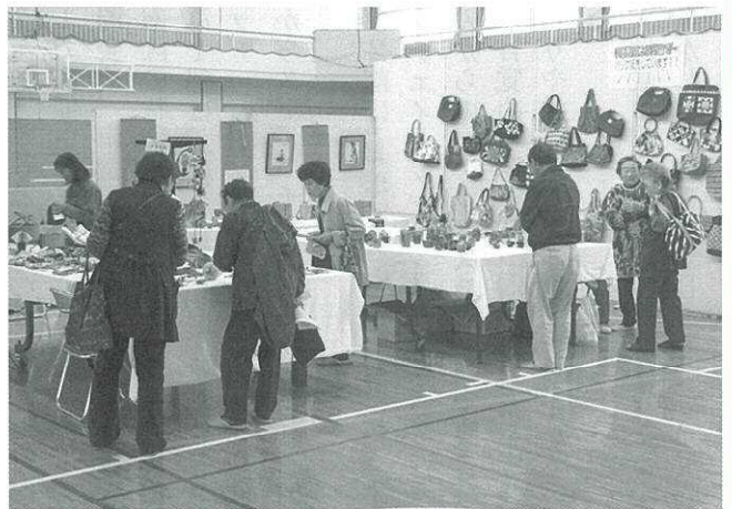
▲ 素晴らしい作品が展示されました