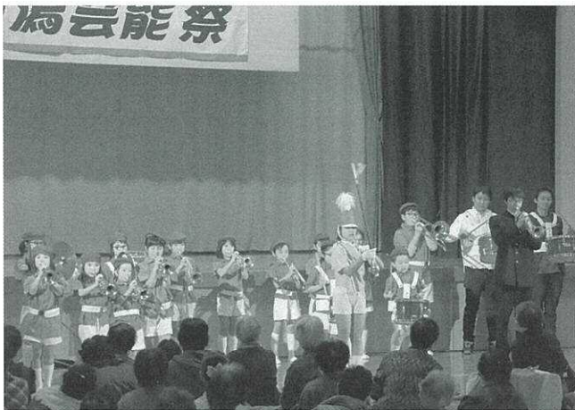
▲ ミュージックメイツさんの演奏