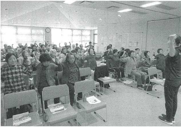
▲ ストレッチをする参加者の皆さん

11月9日(土)、月潟地区社会福祉協議会と保健会主催「福祉と健康のつどい」が月潟健康センターで開催されました。