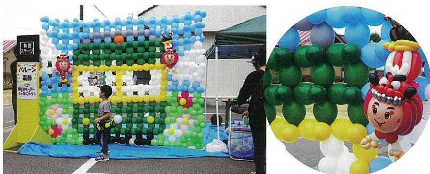
▲ この作品は後日月湯保育園でござっていただきました ▲ アートバルーンの角兵衛獅子