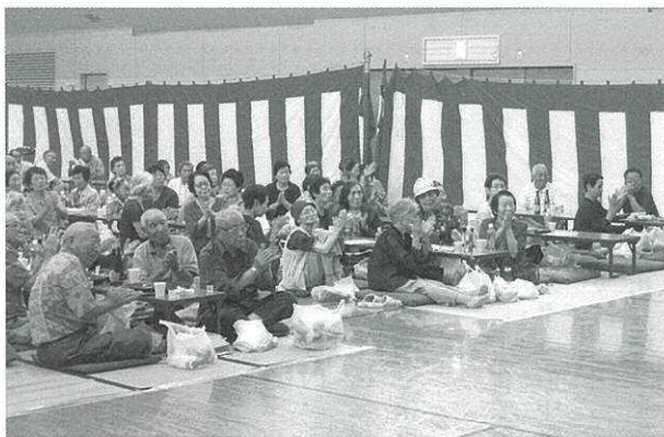
▲ なごやかな一日となりました ▼

お待ちかねの祝宴が始まると、地元芸能3団体のみなさんが、熟練した演奏と、あでやかな踊りによる演目を次々と披露し、招待者のみなさんは、おいしいお弁当やお酒に舌鼓を打ちながら、気の合う仲間同士のおしゃべりとともに、楽しいひとときを過ごされていました。