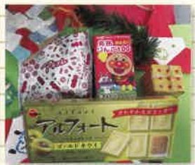
園児さんに X'masプレゼント