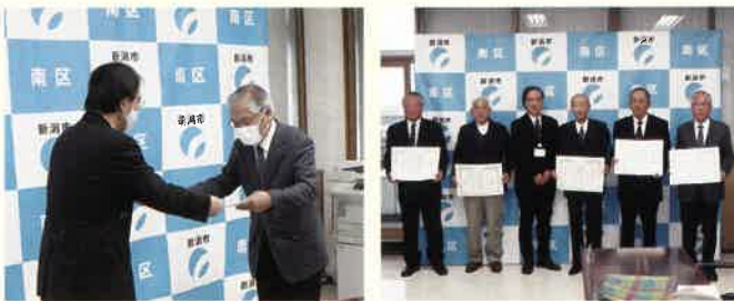
南区長より賞状を授与

住みよい生活環境向上のため、地域の環境美化や環境保全に関する活動に対して表彰されました。今後も継続して活動を行っていきます。