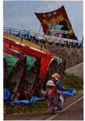
前回準グランプリ作品 「揚がるかな」