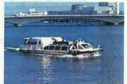
ウォーターシャトル(イメージ)