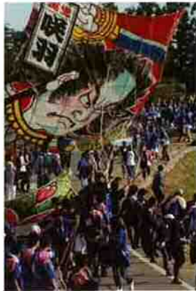
前回準グランプリ作品 「目力で勝つ」