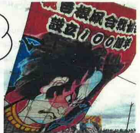
白根大凧(イメージ)