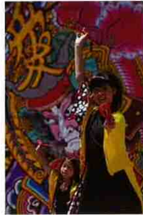
前回グランプリ作品 「華やかに舞う」