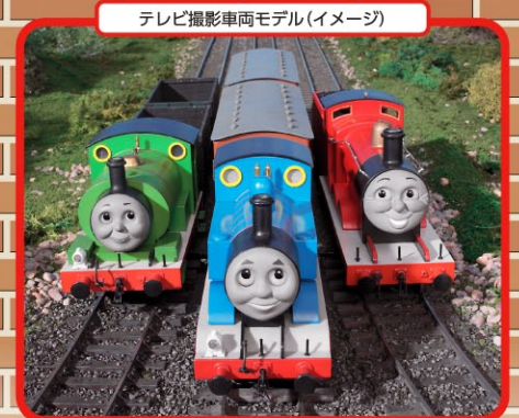
テレビ撮影車両モデル(イメージ)

世界中で愛されている“きかんしゃトーマス”は、イギリスのロングセラー絵本「汽車のえほん(The Railway Series)」から生まれました。原作者のウィルバート・オードリー牧師は、息子のために蒸気機関車のお話を作ります。そのお話は1945年に出版され人気を博し、世界各国で翻訳されて日本では1973年に「汽車のえほん」シリーズとして発行されました。