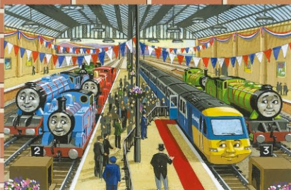
「Golden Jubilee (50年祭)」より C・スポン画 1995年(未邦訳)