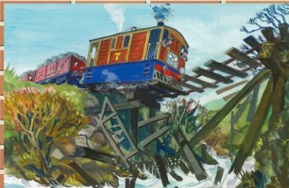
「トビーのつなわり」より エドワーズ夫妻画 1972年