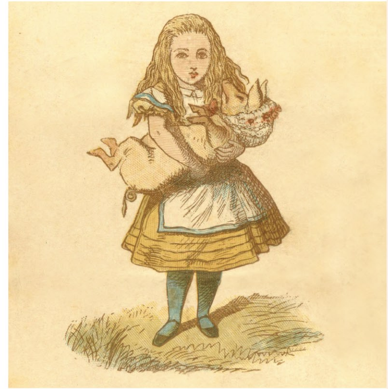
ルイス・キャロル《切手ケース》(部分) 1890年 Lewis Carroll, The Wonderland postage stamp case. The Rosenbach, Philadelphia 不思議の国のアリス展 [6月27日(土)～9月6日(日)]に出品予定