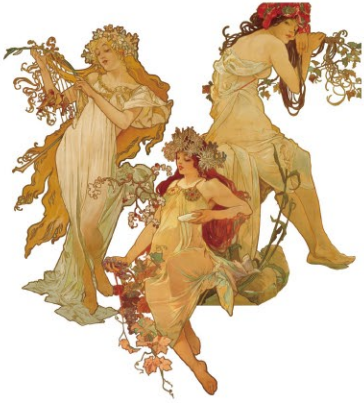
左からアルフォンス・ミュシャ《春》《秋》《夏》(部分)1896年 OZAWAコレクション

本展では、ポスター作品や装飾パネルのほか、挿絵、雑誌、ハガキなどから、今もなお多くの人を魅了してやまないミュシャの創作活動と世界観を広くご紹介します。