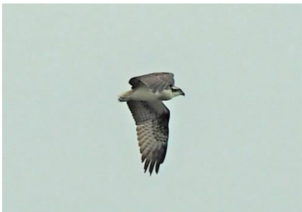
〈 ミサゴ 〉