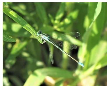
〈 セスジイトトンボ 〉