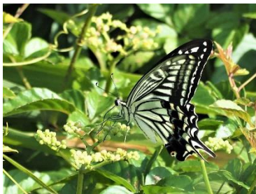
〈 ナミアゲハ 〉

モンシロチョウ、ベニシジミ、ヤマトシジミ、ツバメシジミ、シジミチョウの仲間、ナミアゲハ、アオスジアゲハ、ゴマダラチョウ、キタキチョウ、モンキチョウ、ヒメアカタテハ、イチモンジセセリ、カキバトモエ（幼虫）、ニイニイゼミ、アブラゼミ、ミンミンゼミ、スズメバチの仲間、クマバチ、ミツバチの仲間、ヤマトアシナガバチ、キアシアシナガバチ、アシナガバチの仲間、シオヤアブ、クロアナバチ、オオフタオビドロバチ、コフキトンボ、シオカラトンボ、ウチワヤンマ、セスジイトトンボ、アオモンイトトンボ、チョウトンボ、ショウジョウトンボ、コシアキトンボ、ギンヤンマ、ウスバキトンボ、イナゴ、ホシササキリ、サトクマダモドキ、オナガササキリ、ヒメクサキリ、エンマコオロギ、クルマバッタモドキ、ショウリョウバッタ、ジュウシカメムシの仲間、ハラビロカマキリ、ゴマダラカミキリ、カブトムシ、ノコギリクワガタ、クワガタの仲間、マメコガネ、コフキコガネ、ヒメコガネ、シロテンハナムグリ、オオヒラタシデムシ、アオバハゴロモ、ベッコウハゴロモ、ツマグロオオヨコバイ、ナガコガネグモ、ジョロウグモ、カタツムリの仲間、メダカ、コイ、ライギョ、スジエビ、アメンボの仲間、モツゴ、タモロコ、ヨシノボリ、オオミズスマシ、コムズムシ、ジュズカゲハゼ、ウシガエル、ニホンアマガエル、ヒガシニホントカゲ、ニホンカナヘビ、クサガメ、ミシシippアカミミガメ、スッポン、