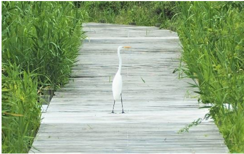
〈 ダイサギ 〉

キジ、マガン、カルガモ、カイツブリ、カンムリカイツブリ、キジバト、カワウ、ヨシゴイ、ゴイサギ、アオサギ、ダイサギ、チュウサギ、コサギ、イソシギ、クロハラアジサシ、ミサゴ、トビ、オオタカ、カワセミ、コゲラ、モズ、オナガ、ハシボソガラス、ハシブトガラス、シジュウカラ、ヒバリ、ツバメ、ヒヨドリ、ウグイス、メジロ、オオヨシキリ、コヨシキリ、ムクドリ、コムクドリ、スズメ、ハクセキレイ、カワラヒワ、ホオジロ、アオジ