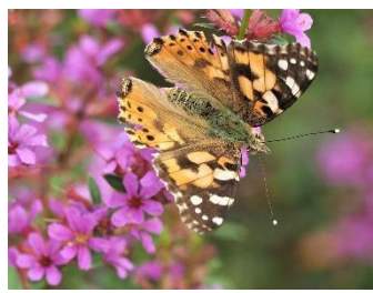
〈 ヒメアカタテハ 〉