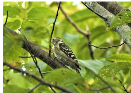
〈 コゲラ 〉