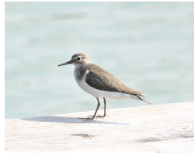
〈 イソシギ 〉