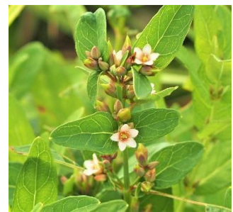
〈 ミズオトギリ 〉