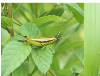
〈 イナゴ 〉