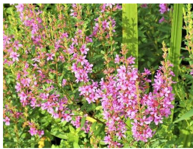
〈 ミソハギ 〉