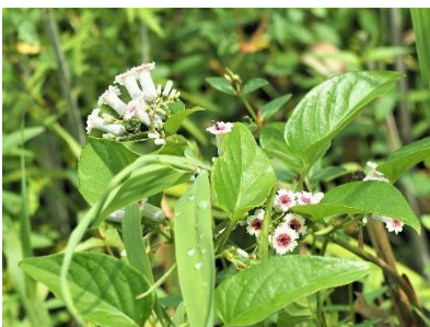
〈 ヘクソカズラ 〉

ノゲシ、スギナ、ダイコンソウ、ユキノシタ、ヨモギ、ハルノノゲシ、セイヨウタンポポ、ショウブ、ツルボ、スイバ、ヒメスイバ、カタバミ、ハナニガナ、シロツメクサ、コウホネ、フトイ、ホタルイ、ケキツネノボタン、ニワゼキショウ、オオマルバノホロシ、ウキヤガラ、ヒシ、デンジソウ、ヒメジョオン、セリ、チチコグサ、ギシギシ、オニノゲシ、オニタビラコ、ガマ、ウシノケグサ、ホソムギ、シラゲガヤ、ブタナ、ムギグサ、コモチマンネングサ、ヤブジラミ、ホタルブクロ、ミツバ、ハス、ハンゲショウ、クサノオ、オオバコ、ヌマトラノオ、イヌゴマ、チゴザサ、ヤマアワ、ツユクサ、ミソカクシ、アレチマツヨイグサ、オオマツヨイグサ、ミソハギ、ミズオトギリ、オニユリ、ゲンノショウコ、ハキダメギク、センニンソウ、ハッカ、オオフタバムグラ、ゲンノショウコ、ミズヒキ、テッポウユリ、キツタ、スイカズラ、キカラスウリ、ノブドウ、ヒルガオ、クズ、アオツツラフジ、ヘクソカズラ、ヤブガラシ、ヒヨドリジョウゴ、ツルマメ、ガガイモ、ヤツデ、ヤブツバキ、アオキ、モッコク、トベラ、エノキ、タチヤナギ、コブシ、ソメイヨシノ、オオシマザクラ、クワ、オニグルミ、クヌギ、ウバメガシ、コマユミ、ケヤキ、コナラ、ニワトコ、アカメガシワ、タブノキ、エゴノキ、ノイバラ、ヒョウタンボク、ニワウルシ、ウコギ、シロダモ、ハマナス、ネムノキ、コムラサキシキブ、マユミ、ツルウメモドキ、ヤマウコギ、アオギリ、ムクゲ、サルスベリ、