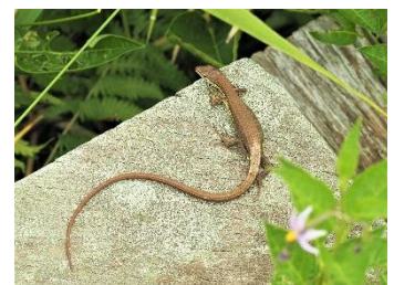
〈 ニホンカナヘビ 〉