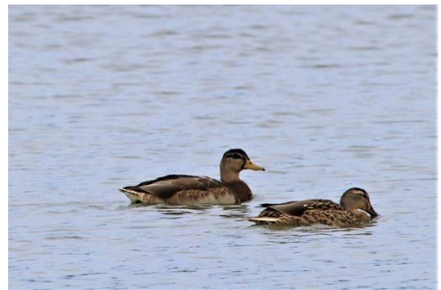
〈 マガモ (換羽中) 〉