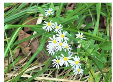
〈 ノコンギク 〉