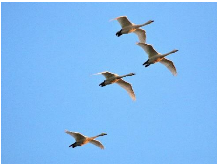
〈 コハクチョウ 〉

キジ、ヒシクイ、マガン、コハクチョウ、オオハクチョウ、オカヨシガモ、ヒドリガモ、マガモ、カルガモ、ハシビロガモ、オナガガモ、コガモ、ホシハジロ、キンクロハジロ、カイツブリ、ハジロカイツブリ、カンムリカイツブリ、キジバト、カワウ、ヨシゴイ、ゴイサギ、アオサギ、ダイサギ、コサギ、バン、オオバン、アジサシの仲間、ミサゴ、トビ、チュウヒ、ノスリ、カワセミ、コゲラ、アオゲラ、チョウゲンボウ、ハヤブサ、モズ、オナガ、ミヤマガラス、ハシボソガラス、ハシブトガラス、シジュウカラ、ヒバリ、ツバメ、ヒヨドリ、ウグイス、エナガ、メジロ、ムクドリ、ジョウビタキ、スズメ、ハクセキレイ、セグロセキレイ、カワラヒワ、イカル、ホオジロ、アオジ、オオジュリン