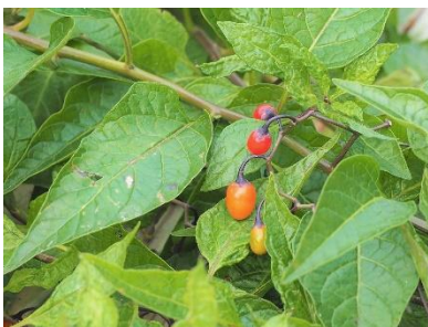
〈 オオマルバノホロシ (実) 〉

ノゲシ、スギナ、ヨモギ、セイヨウタンポポ、カタバミ、シロツメクサ、コウホネ、フトイ、ホタルイ、ケキツネノボタン、ニワゼキショウ、オオマルバノホロシ、ウキヤガラ、ヒシ、デンジソウ、ヒメジョオン、セリ、チチコグサ、オニタビラコ、ガマ、ブタナ、ハス、オオバコ、ヤハズソウ、スズメノヒエ、イヌゴマ、チゴザサ、ツユクサ、ミソカクシ、ミソハギ、ゲンノショウコ、ハキダメギク、ハッカ、ミズヒキ、サクラタデ、ヒメシロネ、シロバナサクラタデ、アメリカタカサブロウ、タケトアゼナ、キンエノコロ、カゼクサ、ヒメクグ、ノコンギク、アキノノゲシ、トキワハゼ、ヌカキビ、チカラシバ、イヌタデ、オオイヌタデ、ヒメジソ、メヒシバ、イボクサ、アメリカセンダングサ、タウコギ、クサネム、アキノウナギツカミ、セイタカアワダチソウ、ミソソバ、イシミカワ、アキノキリンソウ、オオアレチノギク、ヒメムカシヨモギ、キツタ、スイカズラ、キカラスウリ、ノブドウ、ヒルガオ、クズ、アオツツラフジ、ヘクソカズラ、ヤブガラシ、ヒヨドリジョウゴ、ツルマメ、ガガイモ、カナムグラ、ヤブマメ、ヤツデ、ヤブツバキ、アオキ、モッコク、トベラ、エノキ、タチヤナギ、コブシ、ソメイヨシノ、オオシマザクラ、クワ、オニグルミ、クヌギ、ウバメガシ、コマユミ、ケヤキ、コナラ、ニワトコ、ナワシログミ、アカメガシワ、タブノキ、エゴノキ、ノイバラ、ニワウルシ、ウコギ、シロダモ、ハマナス、ネムノキ、コムラサキシキブ、マユミ、ヤマウコギ、アオギリ、ムクゲ、サルスベリ、ヤマボウシ、ヌルデ、ツルウメモドキ