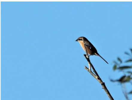
〈 モズ 〉