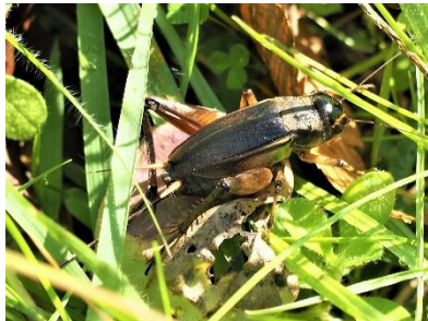
〈 エンマコオロギ 〉

モンシロチョウ、ベニシジミ、ヤマトシジミ、シジミチョウの仲間、キタキチョウ、モンキチョウ、ヒメアカタテハ、イチモンジセセリ、ホウジャクの仲間、ミノウスバ、スズメバチの仲間、クマバチ、ミツバチの仲間、アシナガバチの仲間、セグロアシナガバチ、オオフトオビドロバチ、ギンヤンマ、オニヤンマ、アキアカネ、ノシメトンボ、コバネイナゴ、ツツシサセコオロギ、ショウリョウバッタ、カントク、コバネササキリ、ハラビロカマキリ、チョウセンカマキリ、コカマキリ、オヒラタシテムシ、ツマグロオオヨコバイ、ジョロウグモ、ミノムシの仲間 コイ、ライギョ、 ウシガエル、ニホンアマガエル、アズマヒキガエル、ヒガシニホントカゲ、 クサガメ、ミシシippアカミミガメ、