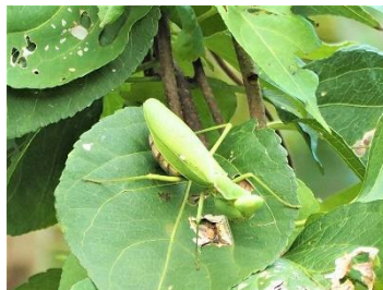
〈 ハラビロカマキリ 〉