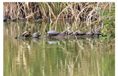
〈 ミシシippアカミミガメ 〉