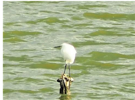
〈 コサギ 〉