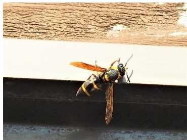
〈 オオフトオビドロバチ 〉