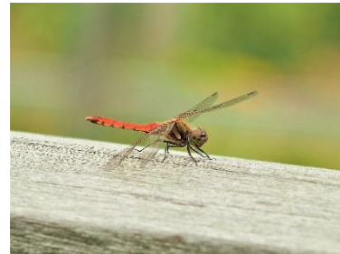
〈 アキアカネ 〉