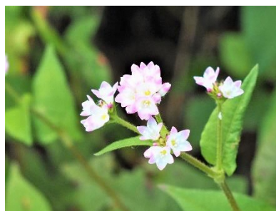
〈 ミソソバ 〉