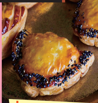
いもジェンヌの アップルパイ