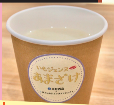
いもジェンヌあまざけ