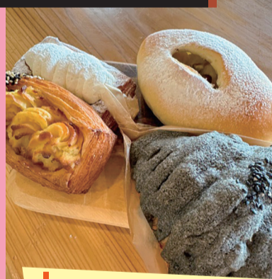
いもジェンヌ デニッシュ