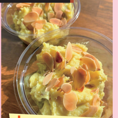
いもジェンヌと キヌアのサラダ