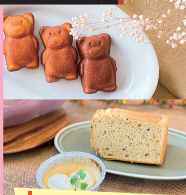
フィナンシェ シフォンケーキ