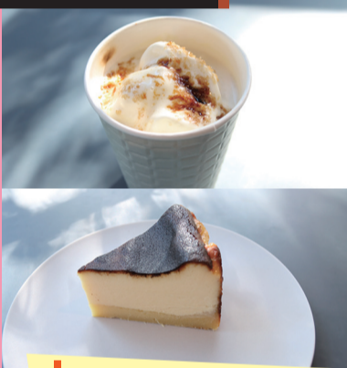
ブリュレラテ バスクチーズケーキ