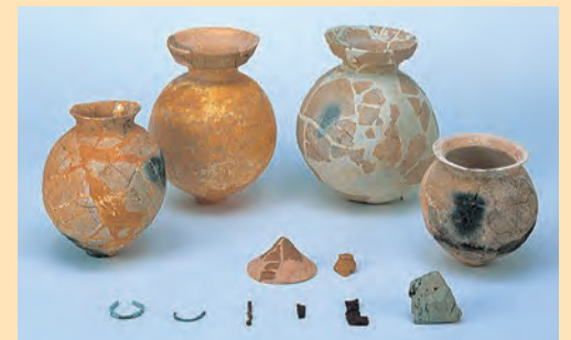
山谷古墳から出土した遺物

山谷古墳からは土器やガラス小玉などが見つかっています。こうした遺物は当時の社会をうかがい知るうえで重要な資料となっています。