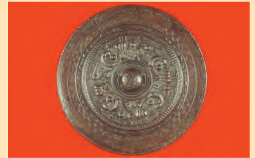
甕龍鏡(だりゅうきょう)

甕龍とは中国に伝わる霊獣のこと。このような鏡は、ヤマト王権から各地の首長へ功績や信任の証として贈られたとする説が有力です。