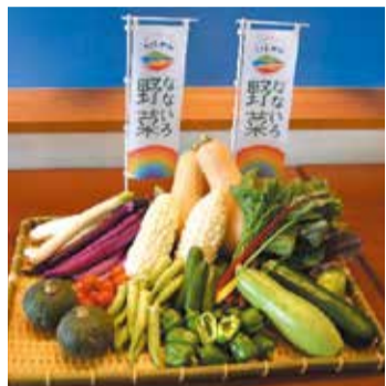
試食会で使用したなないろ野菜