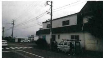
防犯カメラ ビジョン金子前

以前より検討されていた通学路を主体とした防犯カメラは、峰岡地区コミ協、巻北小学校、巻南小学校と協議を重ね、巻地区まちづくり協議会と峰岡地区コミュニティ協議会で3か所ずつ分担して設置しました。