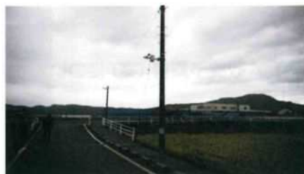
防犯カメラ 堀山新田

令和2年度で実施した空き家調査の結果がまとまりました。これを基に、まちづくりにどのように活用していくのかが、今年度からの課題です。