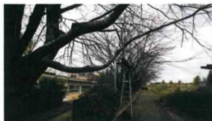
防犯カメラ 矢川公園

まちづくり協議会も結成されて15年経ちました。役職メンバーもだいぶ変わりました。合併当時の様に「合併しても何も良い事はない」と言った言葉が聞こえなくなりました。まちづくり協議会が、少しは何かの役割を果たしたものと思います。