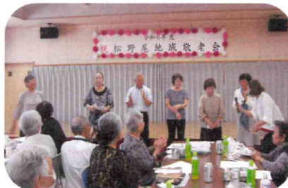
新規対象者の紹介