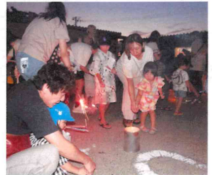
消防団の協力を得て花火をしました