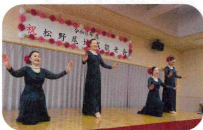
フラダンスの会の皆さん

アトラクションではコミセンを利用して練習されている、フラダンスの会の皆さんによる踊りや福扇会の皆さんによる日本舞踊が披露され好評を博しました。また、参加者と一緒にコミ協役員も「ふるさと」や「おひさしぶりね」の替え歌を歌い、♪来年も 来年も みんな揃って 来年も 来年も ここで会いましょう♪ と再開を約束して万歳三唱で終了しました。