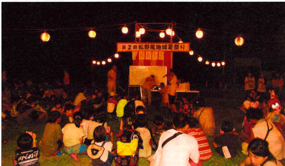
ビンゴゲームの景品は協賛で頂いた日本酒・ビール・お菓子です！