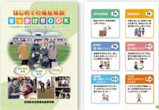
※西蒲区役所2階地域総務課にて配布しております。

保健福祉部会では、毎日の生活の困りごと等について「どこに相談すればいいの?」という疑問が生じた際に、区民の皆さまが利用できる相談窓口が記載された冊子の発行を行いました。