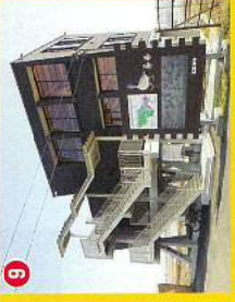
⑨雁来舎 (国指定福島潟鳥獣保護区管理棟)