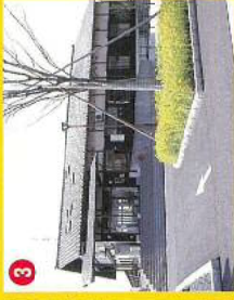
③蔵の宿 菱風荘 (宿泊施設)