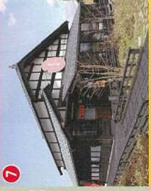
⑦令和元年11月現在 閉店中 (国指定福島潟鳥獣保護区管理棟)