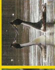
カンムリカイツブリ