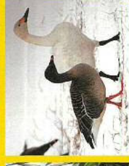
オオヒシクイ・コハクチョウ