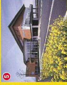
⑤環境と人間のふれあい館