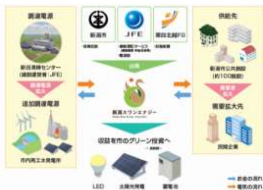
■事業のスキーム図