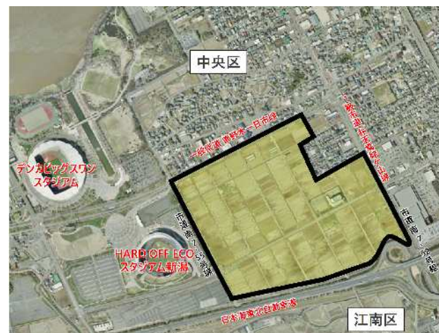
【重点促進区域 令和4年6月設定】