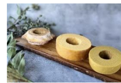
【おにぎり】 【NIIGATA ひかり BAUM】

(3) 販売品目 米、さつまいも、日本梨、あんぽ柿、NIIGATA ひかり BAUM 等 計 28 商品