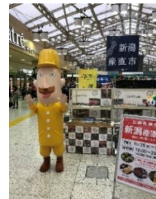
【レルヒさんによるPR】