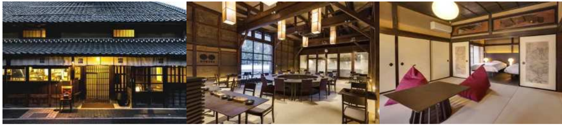
※現在稼働中のNIPPONIA施設

第1期事業では、旧美や古を中心に、エリアマネージメントの手法を取り入れ数棟の改修を予定。待合茶屋の再生や、分散型の古民家ホテルへのリノベーションなど、湊町のおもてなし文化を継承しながら、ヒト・モノ・カネが集まる新潟湊のにぎわい復活を目指します。