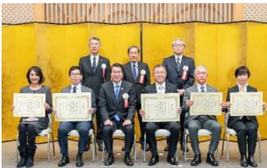
▲昨年の様子（表彰式）

取材いただける場合は、 2月8日（木曜）午後3時まで に、別紙1「取材申込書」により、保健所健康増進課へ連絡願います。