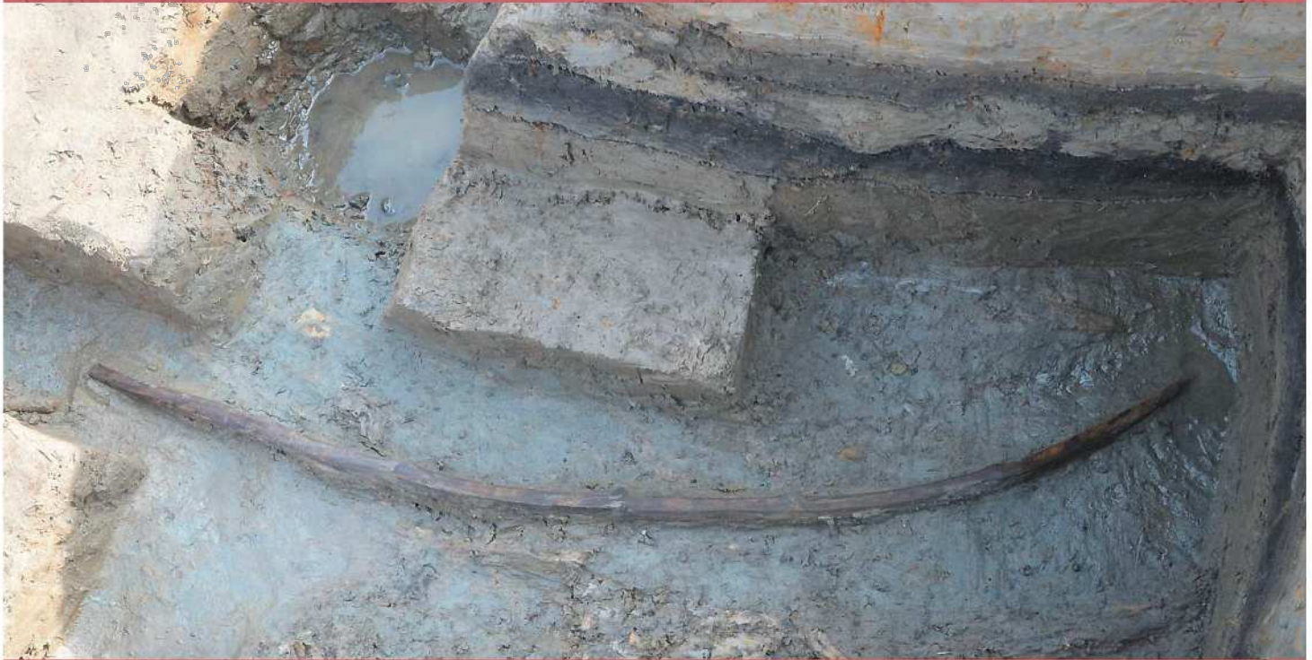
丸木弓出土状況(茶院A遺跡)