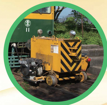
車両移動機「アント」で 電車を走行させます

乗車は事前抽選制! 8月11日10時より予約受付開始します。 詳細は裏面をごらんください ▶▶▶