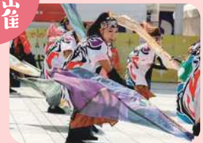
にいがた総おどり