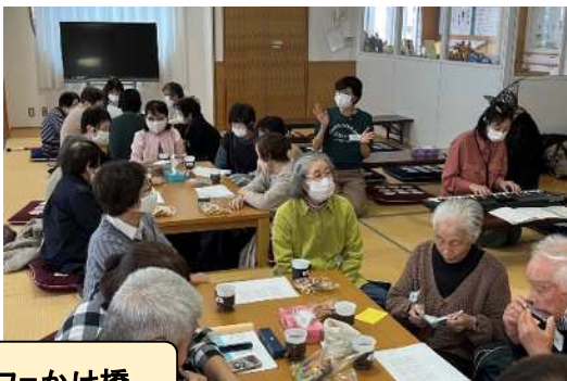
より道カフェかけ橋