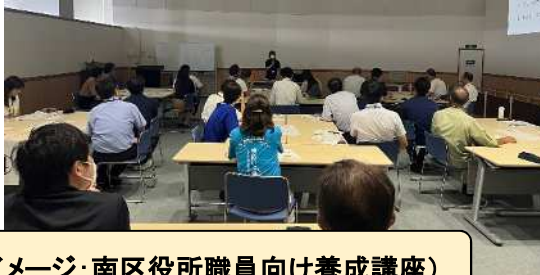
(イメージ: 南区役所職員向け養成講座)

<認知症サポーター養成講座とは> 地域や職域団体等を対象に、認知症の正しい知識や、つきあい方についての講義を行います。