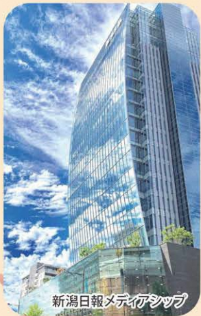
新潟日報メディアタワー