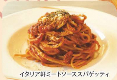
イタリア軒ミートソーススパゲッティ

まち歩きの達人「新潟シティガイド」が、 まちの魅力を分かりやすく解説してくれます。