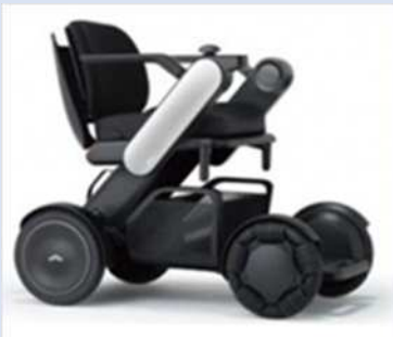
WHILL(株)「WHILL Model C2」