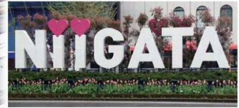
新潟駅前のNIIGATAオブジェもチューリップの植え込みで春らしく。

やすらぎ提緑地(両岸) やすらぎ提の桜並木と、3万2千本のチューリップが春満開の風景を作り出します。 チューリップの球根植え付け作業は、近隣の4つの自治会・町内会、小中学校10校の児童・生徒の皆さまからご協力をいただきました。