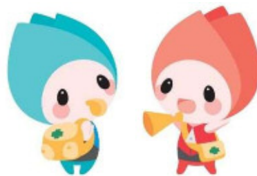
新潟市防災マスコットキャラクター ジージョ・キョージョ

問い合わせ先 新潟市危機管理防災局防災課 担当：瀧澤 電話：025-226-1140 (直通) E-mail：bosai@city.niigata.lg.jp