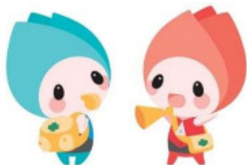
新潟市防災マスコットキャラクター シージョ・キョージョ

問い合わせ先 新潟市危機管理防災局防災課 担当：瀧澤 電話：025-226-1140（直通） E-mail：bosai@city.niigata.lg.jp