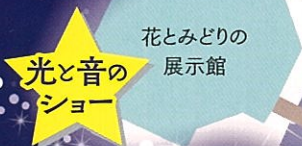
花とみどりの 展示館