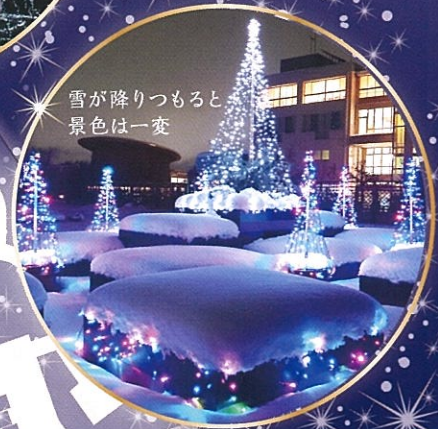
雪が降りつもると 景色は一変