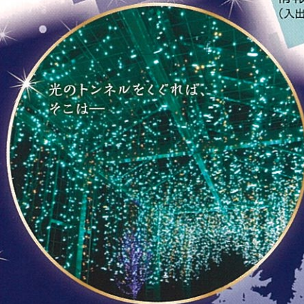
光のトンネルをくぐれば、 そこは—