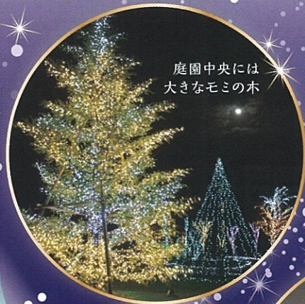
庭園中央には 大きなモミの木