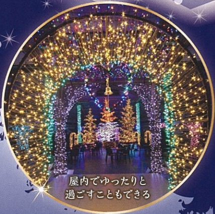
屋内でゆったりと 過ごすこともできる