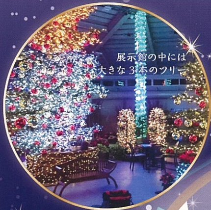
展示館の中には 大きな3本のツリー

Illuminate you & me in fantastic winter garden.