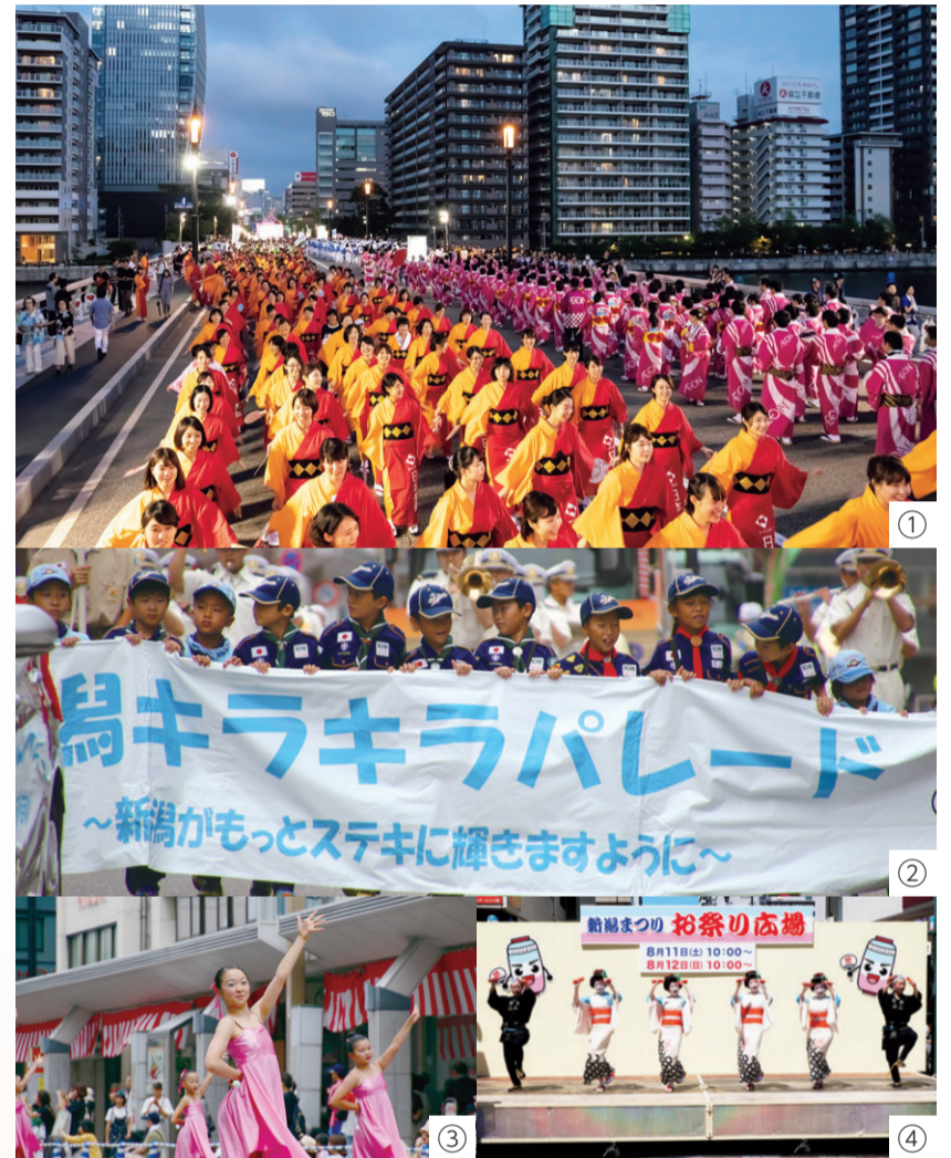
昨年の様子(①大民謡流し②③新潟キラキラパレード④お祭り広場でのステージ発表)