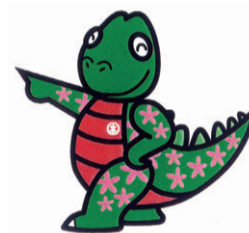
市選挙マスコット トウヒョウザウルス 「きめたろう」