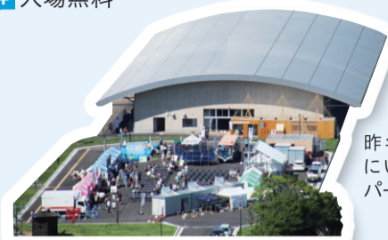
昨年の海フェスタにいがた「海フェスタパーク」の様子

日 7月28日(日)10時~16時 場 万代島多目的広場(中央区万代島) ¥ 入場無料