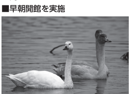
冬鳥の飛来時期に合わせ開館時間を7時に早めます。 日11月2日~