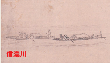
図2 蔵所へ向かう信濃川の川船(芳明筆「新潟町の図屏風」部分、新潟市歴史博物館所蔵)