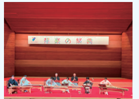
10月20日開催 邦楽の祭典