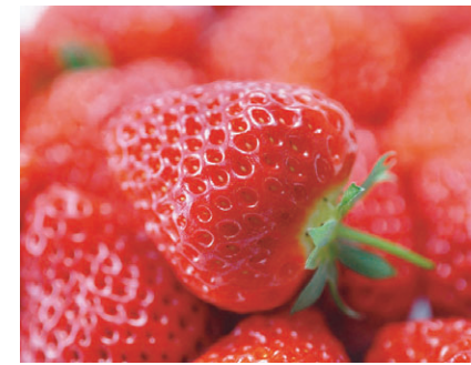
ハウス栽培で収穫した作物は同ハウス組合の共通ブランド「ユニークSUN'S」として販売