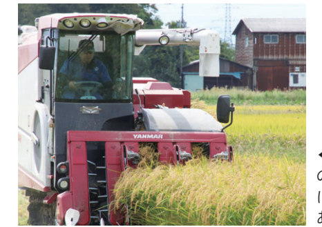
「新潟米のおいしさには自信があります」

編集後記～取材を終えて 新潟の農業を守り続けるため、地域で協力しながら持続可能な農業に取り組んでいる農業者がいるからこそ、私たちはいつでもおいしい物が食べられるのだと実感しました。 私もスーパーなどで買い物をするときには市内産の野菜や果物などを選び、市内の農家を応援していきたいと思います。