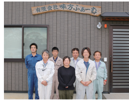
味方ふぁーむの仲間。若い世代が地元に戻り、従業員は増加