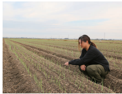
10月中旬に、乾いた田んぼに機械で苗を植える。写真は植え終えた状態のもの