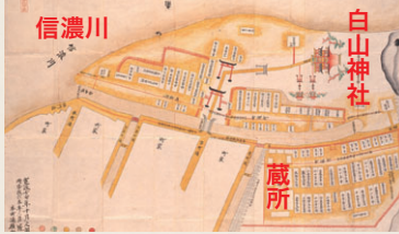
図1 寛政7(1795)年ごろの町蔵の様子(「新潟町横町蔵屋敷銘々名面付絵図」部分、新潟市歴史博物館所蔵)