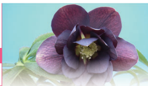
冬の貴婦人 クリスマスローズ