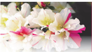
冬の室内を彩る アザレア

新潟市は切り花で全国トップクラスの生産量を誇り、市の花にも指定されています。昨年、チューリップ球根商業生産100周年を迎えました。毎年、約300品種の切り花が全国に出荷されます。