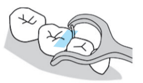
Y字型ホルダー付きの場合